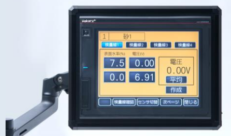
センサー電圧／表面水率