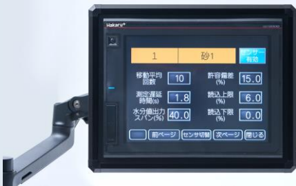
センサーごとの表示設定